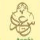
مؤسسة ووقف سعيد السعيد