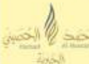
حجج الحجج الخيرية