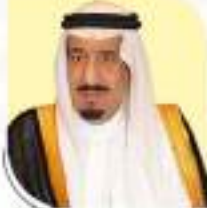
خادم الحرمين الشريفين الملك سلمان بن عبدالعزيز