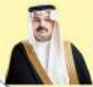
أمير منطقة عسير الأمير فهد بن فهد آل سعود

سمو والدة الأمير عبد العزيز بن محمد آل سعود